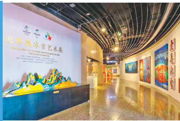
《迎冬奥冰雪艺术展》。