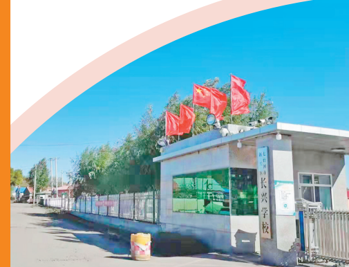
长兴学校周边安装了路灯。