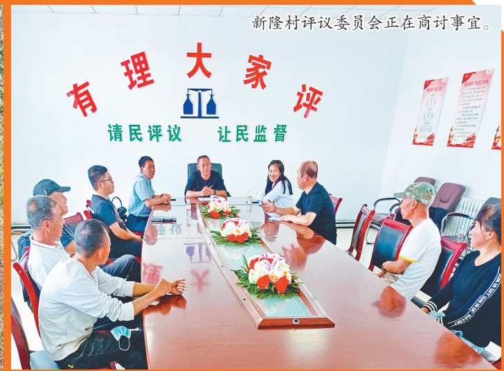
新隆村评议委员会正在商讨事宜。