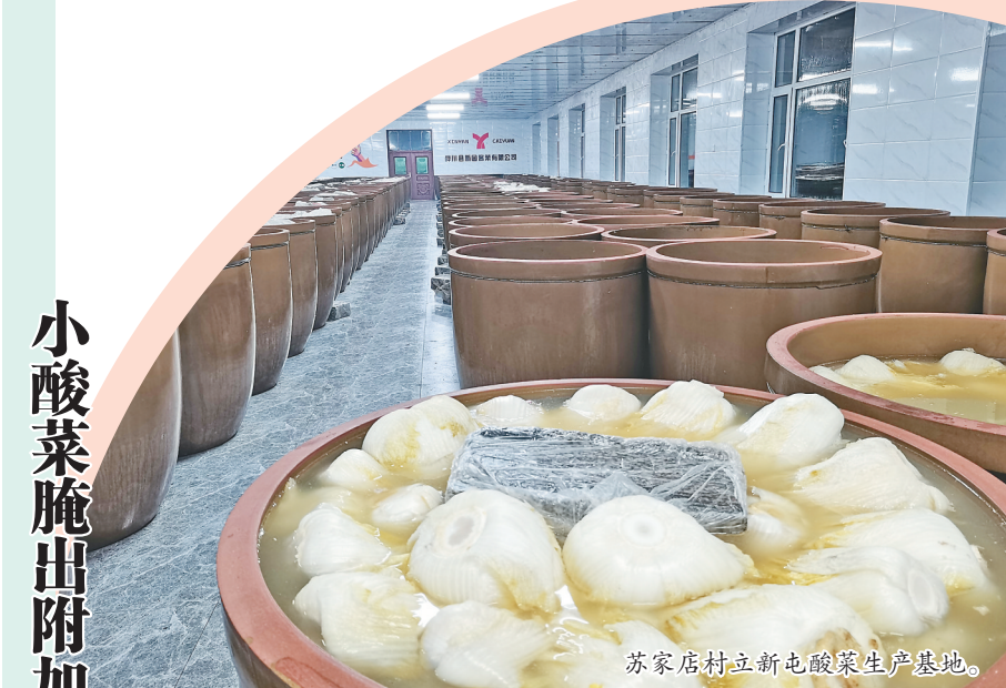
苏家店村立新屯酸菜生产基地。

产业振兴是乡村振兴的物质基础。桦川县苏家店镇苏家店村有一张属于自己的产业名片——注入了科技基因的大缸酸菜。