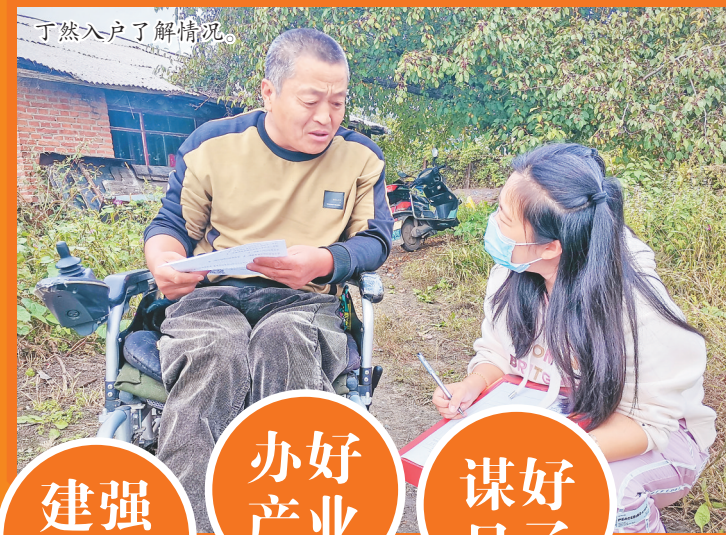
丁然入户了解情况。