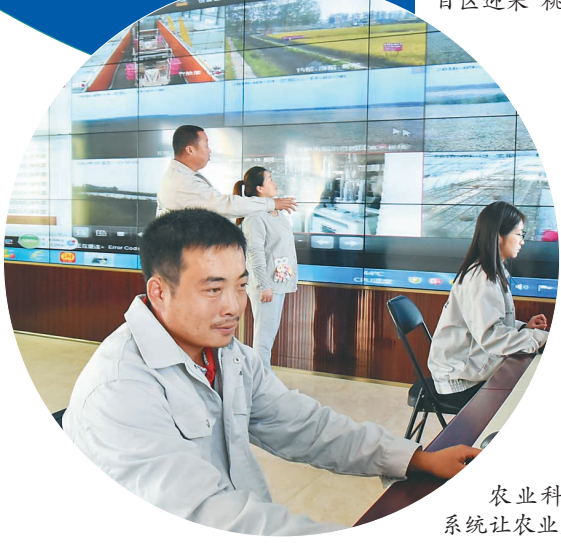
农业科技现代化可追溯系统让农业更科技。