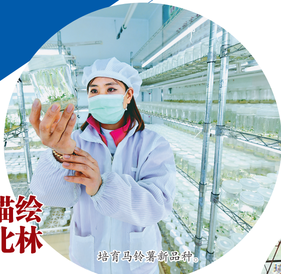
培育马铃薯新品种。

春晓,第一缕曙光刚刚铺上大地,北林城管执法分局的工作人员和环卫工人一起出现在街道上。伴着还有些刺骨的晨风,挥舞着扫帚铁锹,在车水马龙之前,把城市打扫得一尘不染。