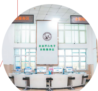
全程电子化自助服务区。