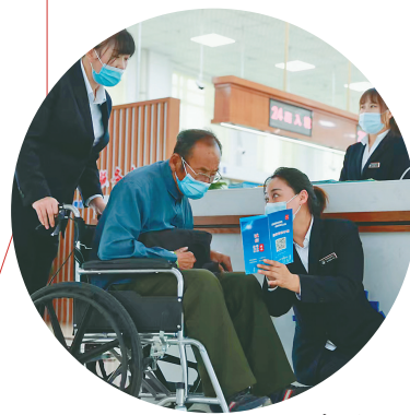
为办事群众进行政策讲解。