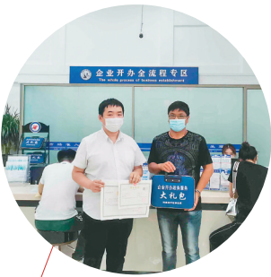
县委主要领导深入行政大厅调研。