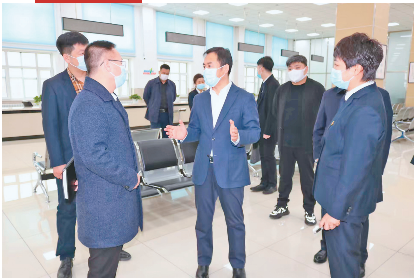
县委主要领导深入行政大厅调研。