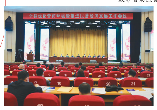
全县优化营商环境大会。