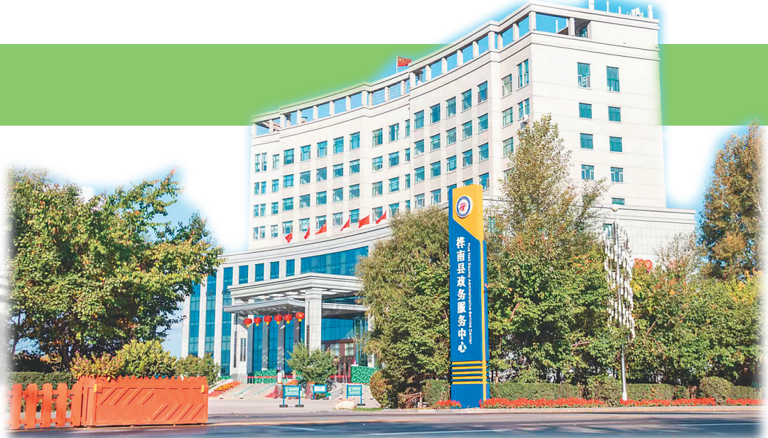
桦南县政务服务中心。