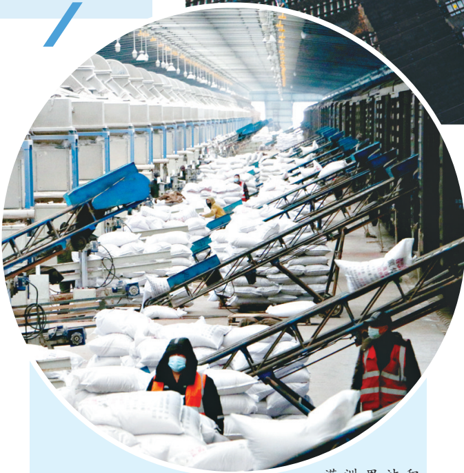
满洲里站积极抢运化肥助力农民春耕。

2018年9月30日,我国最长快速铁路哈佳铁路开通运营,其沿线的不通火车地区一跃进入动车时代;同年12月25日,哈牡高铁开通运营;2021年1月22日,京哈高铁开通运营,哈尔滨至北京全程运行时间缩短至五小时;2021年10月26日佳鹤铁路铺轨完成;2021年12月6日,我国最东高铁牡佳高铁开通运营;2022年,哈伊高铁全面复工……截至目前,哈尔滨局集团公司营业里程达8400多公里,其中高铁动车组运营里程达1400多公里,电气化铁路3200多公里,越织越密的铁路网为龙江的全面振兴全方位振兴架起钢铁跑道。