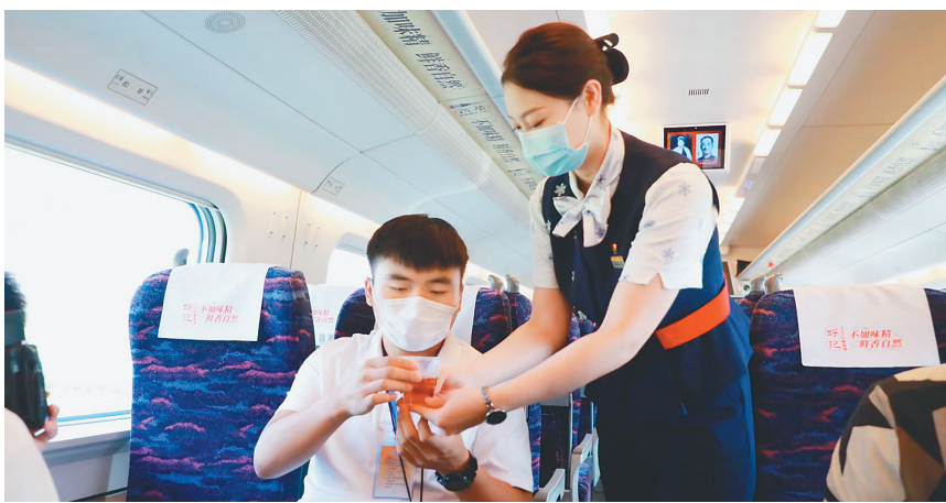
哈牡高铁乘务员悉心服务旅客。