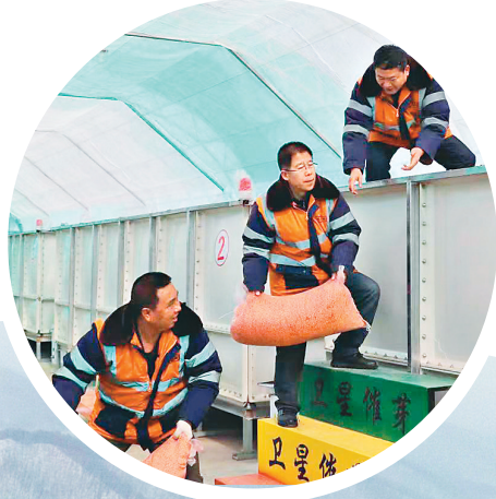
哈尔滨局集团公司驻卫星村工作队建设水稻催芽工厂。

站在历史的节点回眸,那一组组数据可喜增长,见证着国力日益昌盛,拥有百年历史的“龙江号”列车正以饱满的热情、充沛的动力在迎接党的二十大,助推龙江全面振兴全方位振兴加速前行。