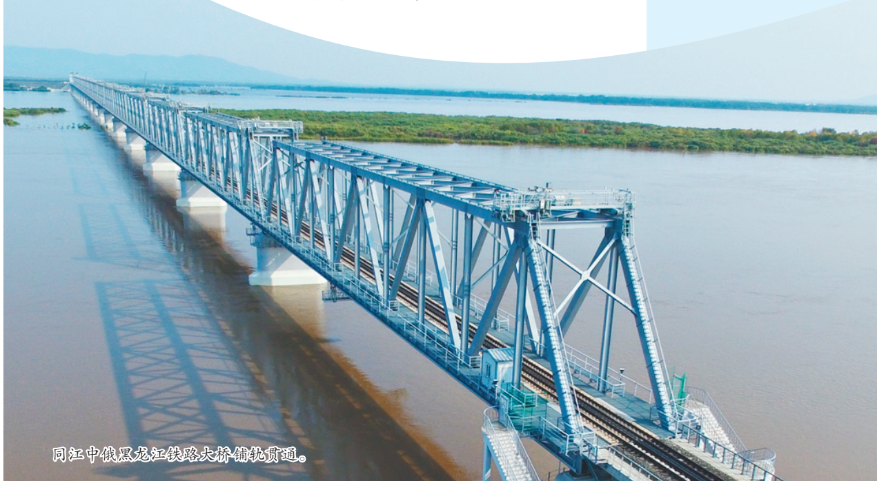
同江中俄黑龙江铁路大桥铺轨贯通。