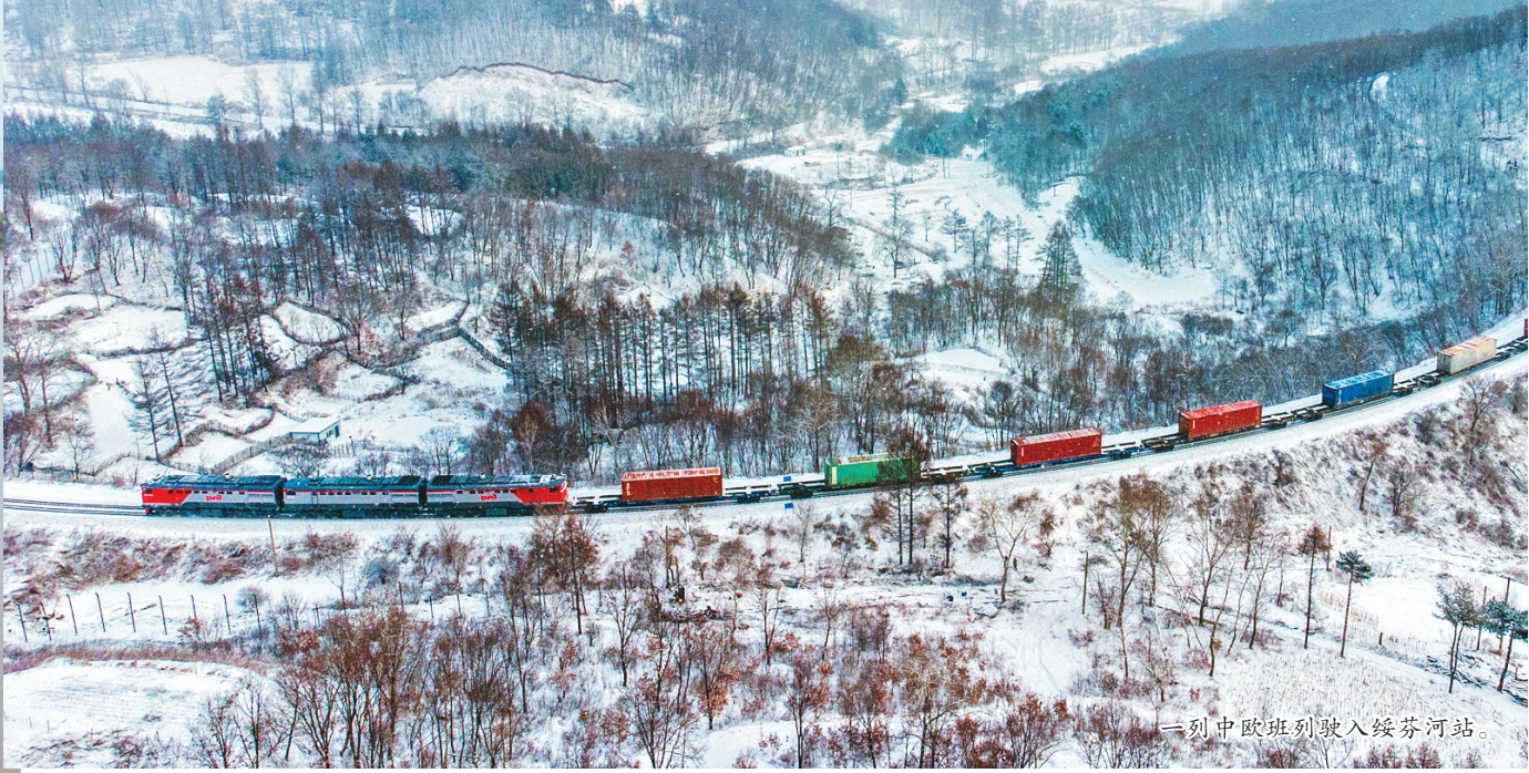
一列中欧班列驶入绥芬河站。