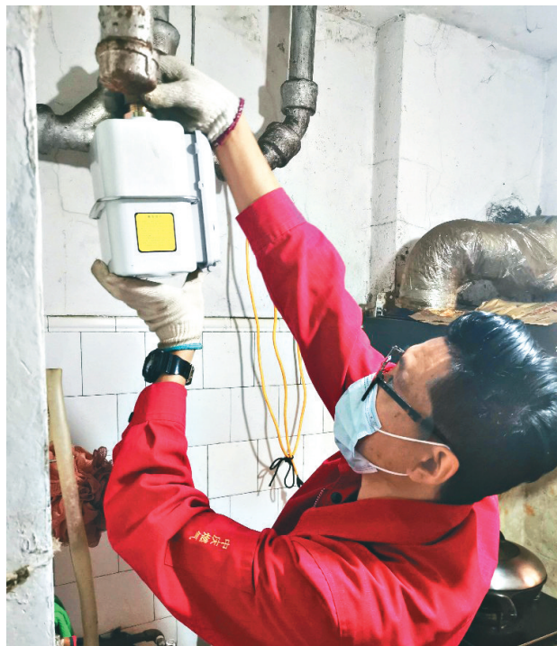
安检人员入户检查燃气设施。

记者跟随中庆燃气安检人员入户采访时发现,很多用户没有安装燃气报警器,即使安装了也未启用,甚至更多用户的燃气报警器不具有报警立即切断功能。此外,还有燃气炉灶过期、橡胶管老化等问题。据哈尔滨中庆燃气公司统计,近年来漏气报修事件逐年增加,2020年漏气报修数量为3688个,2021年增加到4796个,增长了30%。因为不断出现安全问题,该公司今年加大安检力度,由两年一次入户安全检查,变成一年一检。