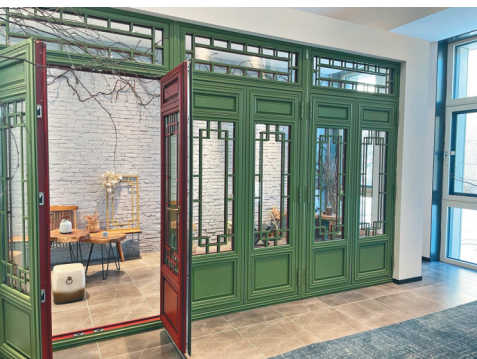
符合超低能耗要求的被动式门窗产品展示。

本报讯(黑龙江日报全媒体记者孙铭阳)近日,黑龙江省工信厅、财政厅和住建厅联合印发《关于支持超低能耗建筑产业发展的若干政策措施》(以下简称《政策措施》),从加大推广力度、强化政策引导、推动产业链生成等3大部分16个方面,推动我省超低能耗建筑产业发展,培育新经济增长点。