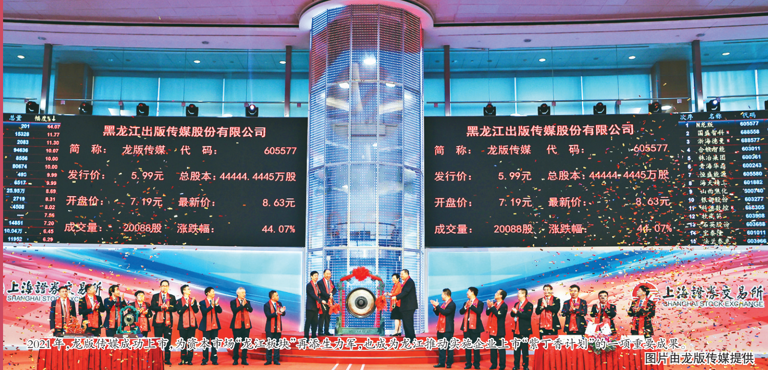
2021年,龙版传媒成功上市,为资本市场“龙江板块”再添生力军,也成为龙江推动实施企业上市“紫丁香计划”的一项重要成果。