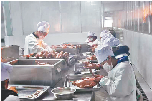
黑龙江鹅香久食品有限公司熟食车间。

本报讯(黑龙江日报全媒体记者董盈)日前,省工信厅、省农业农村厅联合印发了《黑龙江省鹅产业振兴行动计划(2022—2025年)》(以下简称《计划》),充分开发我省鹅资源潜在优势,扩大产业规模,延伸产业链条,提高产业层次,推动我省鹅产业高质量发展。