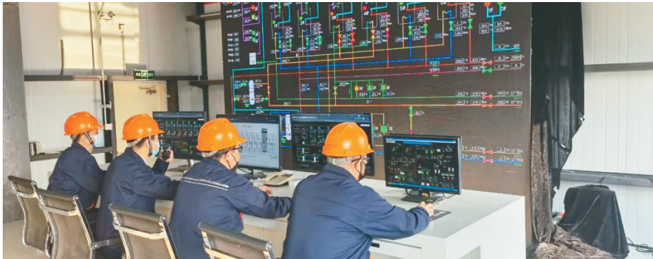
控制中心指挥运行调节。

我省现有供热面积10亿多平方米,冬季寒冷,供热期长达半年以上,随着环保投入和煤价升高,很多供暖企业面临亏损,急需突破性的技术来降低成本,环保达标。华热能源凭借自身的优势构建了从源头到末端的一体化技术解决方案,实现了热源零成本余热提取、热网远