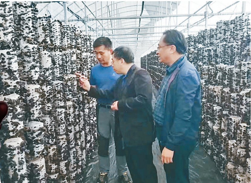
科研人员对黑木耳规模化生产进行技术指导。