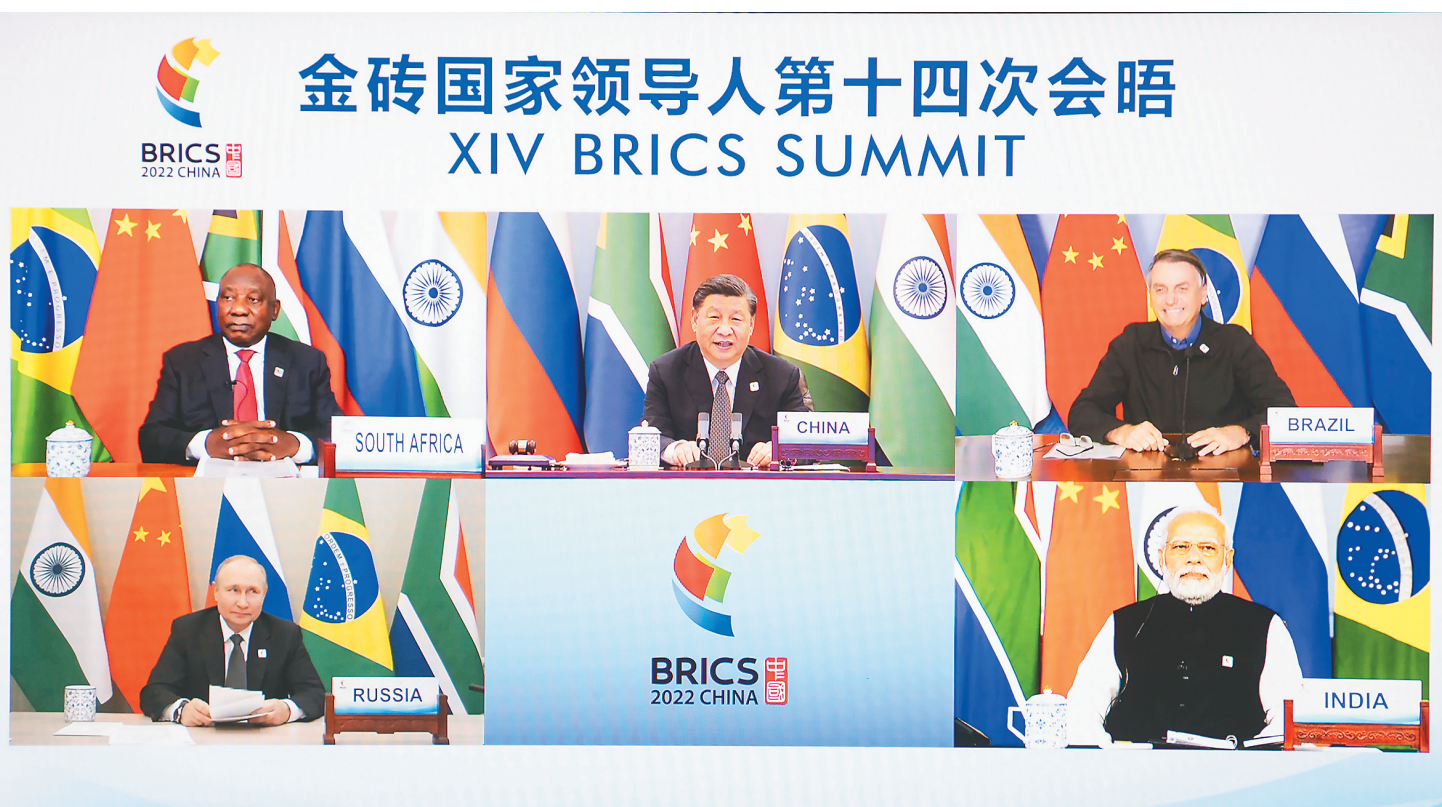
6月23日晚,国家主席习近平在北京以视频方式主持金砖国家领导人第十四次会晤并发表题为《构建高质量伙伴关系 开启金砖合作新征程》的重要讲话。南非总统拉马福萨、巴西总统博索纳罗、俄罗斯总统普京、印度总理莫迪出席。

新华社北京6月23日电(记者杨依军)国家主席习近平23日晚在北京以视频方式主持金砖国家领导人第十四次会晤。南非总统拉马福萨、巴西总统博索纳罗、俄罗斯总统普京、印度总理莫迪出席。人民大会堂东大厅花团锦簇,金砖五国国旗整齐排列,与金砖标识交相辉映。 晚8时许,金砖五国领导人集体“云合影”,会晤开始。 习近平首先致欢迎辞。习近平指出,回首过去一年,面对严峻复杂的形势,金