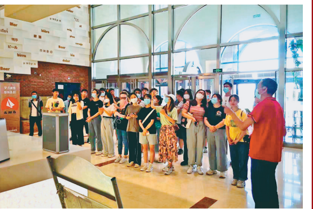
游客体验生产流程。