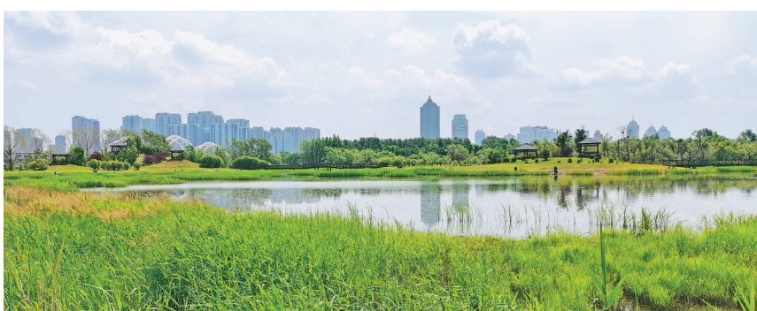
哈尔滨中东铁路水上公园湿地。