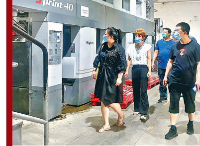
游客参观日本10色对开胶印机。