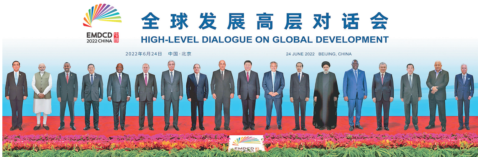
↑ 6月24日晚，国家主席习近平在北京以视频方式主持全球发展高层对话会并发表题为《构建高质量伙伴关系 共创全球发展新时代》的重要讲话。这是与会各国领导人的“云合影”。