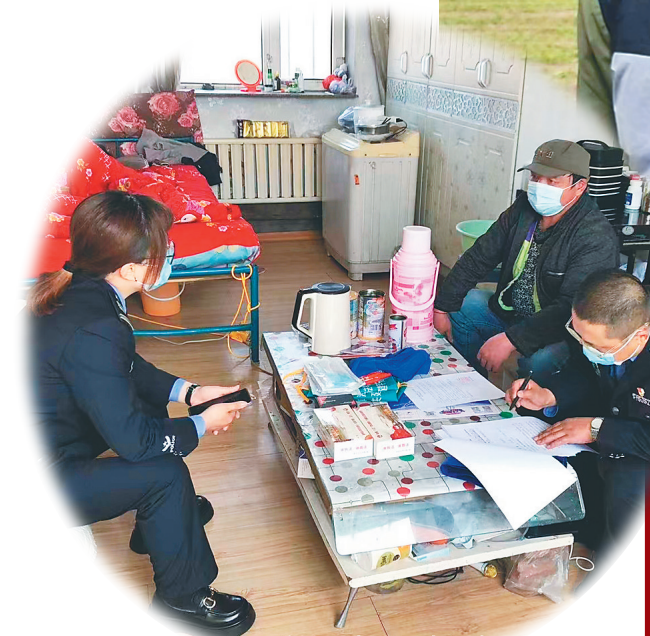
法律援助中心工作人员上门服务。

六月的虎林,绿树成荫,繁花似锦,到处充盈着向上的力量。虎林市深入开展机关“能力作风建设年”活动,“学、干、攻”协同推进,全市机关能力作风建设成效扎实显著。