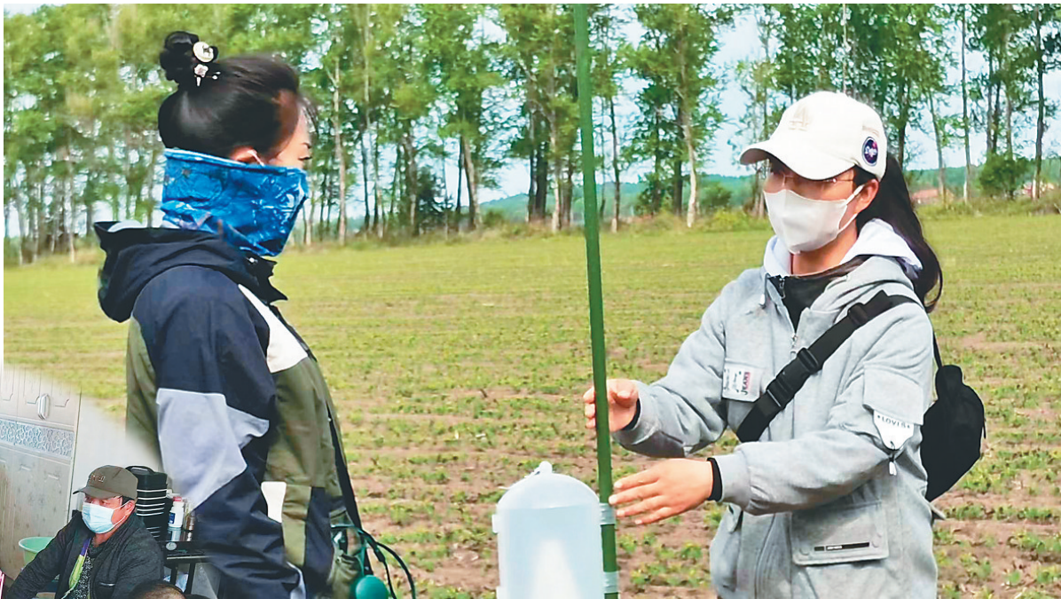
农技课堂“搬”到田间地头。