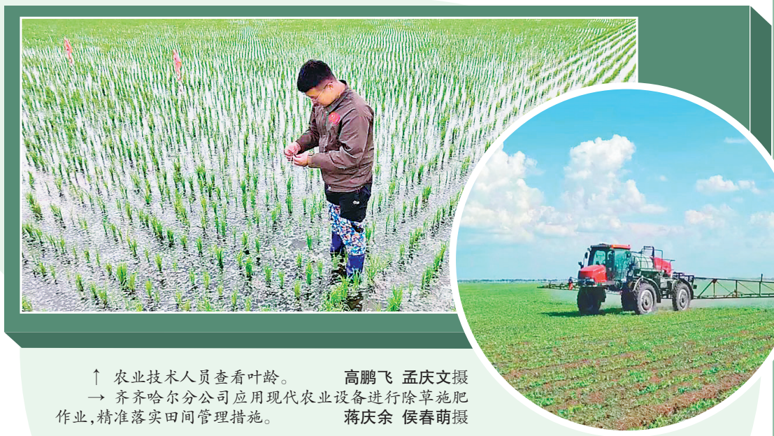
↑ 农业技术人员查看叶龄。 → 齐齐哈尔分公司应用现代农业设备进行除草施肥作业,精准落实田间管理措施。

红卫农场有限公司农业技术人员组成党员干部技术服务队,每隔5天开展一次水稻叶龄调查,他们逐户走访、逐块查看,全面了解秧苗长势,根据水稻生育进程,进行面对面对分类指导,提出切实可行的技术管理意见。针对插秧后期低温多雨,部分稻苗生长迟缓的实际情况,农技人员指导种植户给弱苗适量喷施微肥,通过吃“小灶”的方式促进苗情整体提升,为今年水稻丰产丰收提供技术保障。