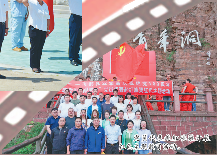
党员代表赴红旗渠开展红色主题教育活动。