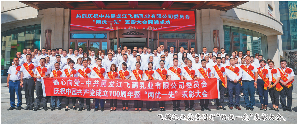
飞鹤乳业党委召开“两优一先”表彰大会。

近日,飞鹤再次完成行业内乳铁蛋白产业化“零”的突破,应用当前国内最先进的生产技术,建成了我国行业内第一条乳铁蛋白自动化生产线,实现了乳铁蛋白的提取和保护,实现技术链的国产化,解决了国内乳铁蛋白生产的成本问题。