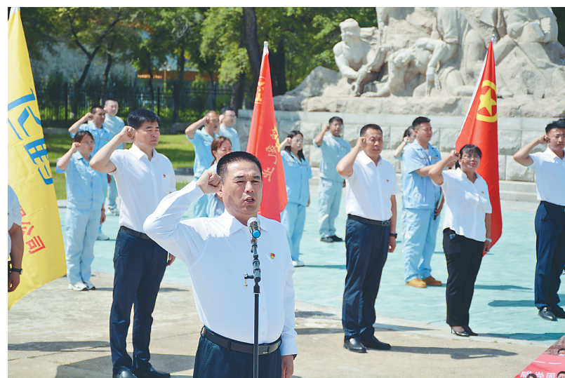
飞鹤乳业党委举行主题党日活动,党团员代表在党旗庄严宣誓。