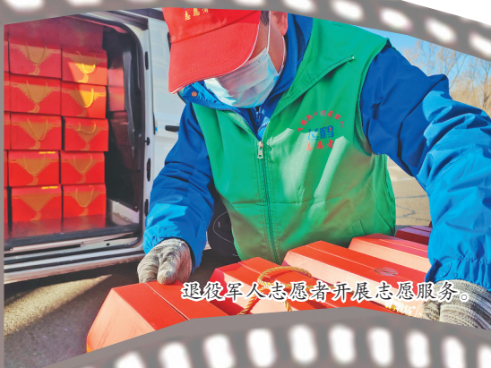
退役军人志愿者开展志愿服务。