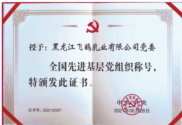
荣获全国先进基层党组织称号。

飞鹤乳业党委全面做好“双拥”工作,2020年,通过飞鹤慈善基金会向中国航天第五实验室文昌转运站的航天工作人员捐赠30万元飞鹤奶粉。2021年初,通过飞鹤慈善基金会,向海军齐齐哈尔舰官兵捐赠价值30万元的物资,并向齐齐哈尔舰的9名官兵家属的“南沙宝宝”捐赠飞鹤星飞帆奶粉,承诺一直供应到3周岁。2022年4月,飞鹤乳业出资五十余万元,为齐齐哈尔市建华区人武部援建民兵训练基地设施。多年来,飞鹤乳业累计安置退役军人、军属2000余人次,每年面向自主就业退役军人提供1200个优先就业岗位,再次彰显了知名民族乳企的责任和担当。