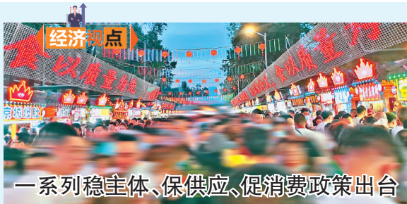
一系列稳主体、保供应、促消费政策出台