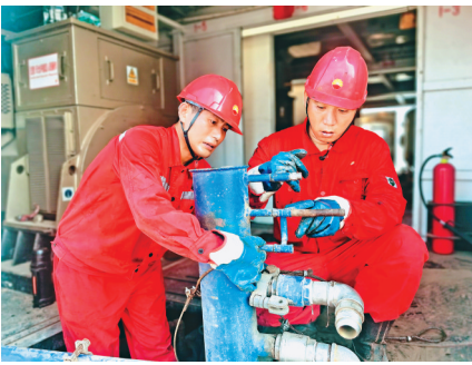
员工顶着高温作业。