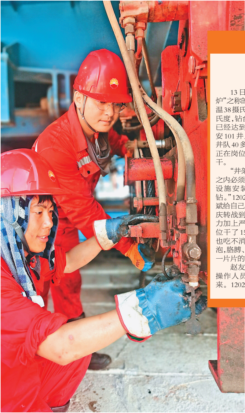
员工在重庆高温作业。