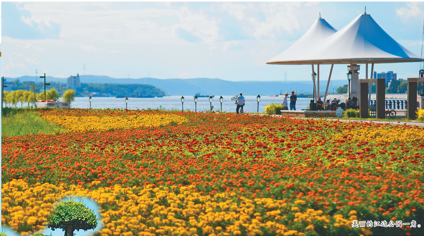
美丽的江边公园一角。

黑河市将继续全力做好城市景观和各项基础设施等民生工程,强调标准是要扮美“面子”,更要做实“里子”,建设和改造的工程要让百姓真正满意。