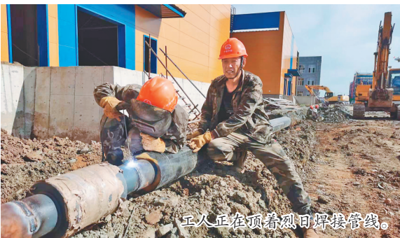
工人正在顶着烈日焊接管线。