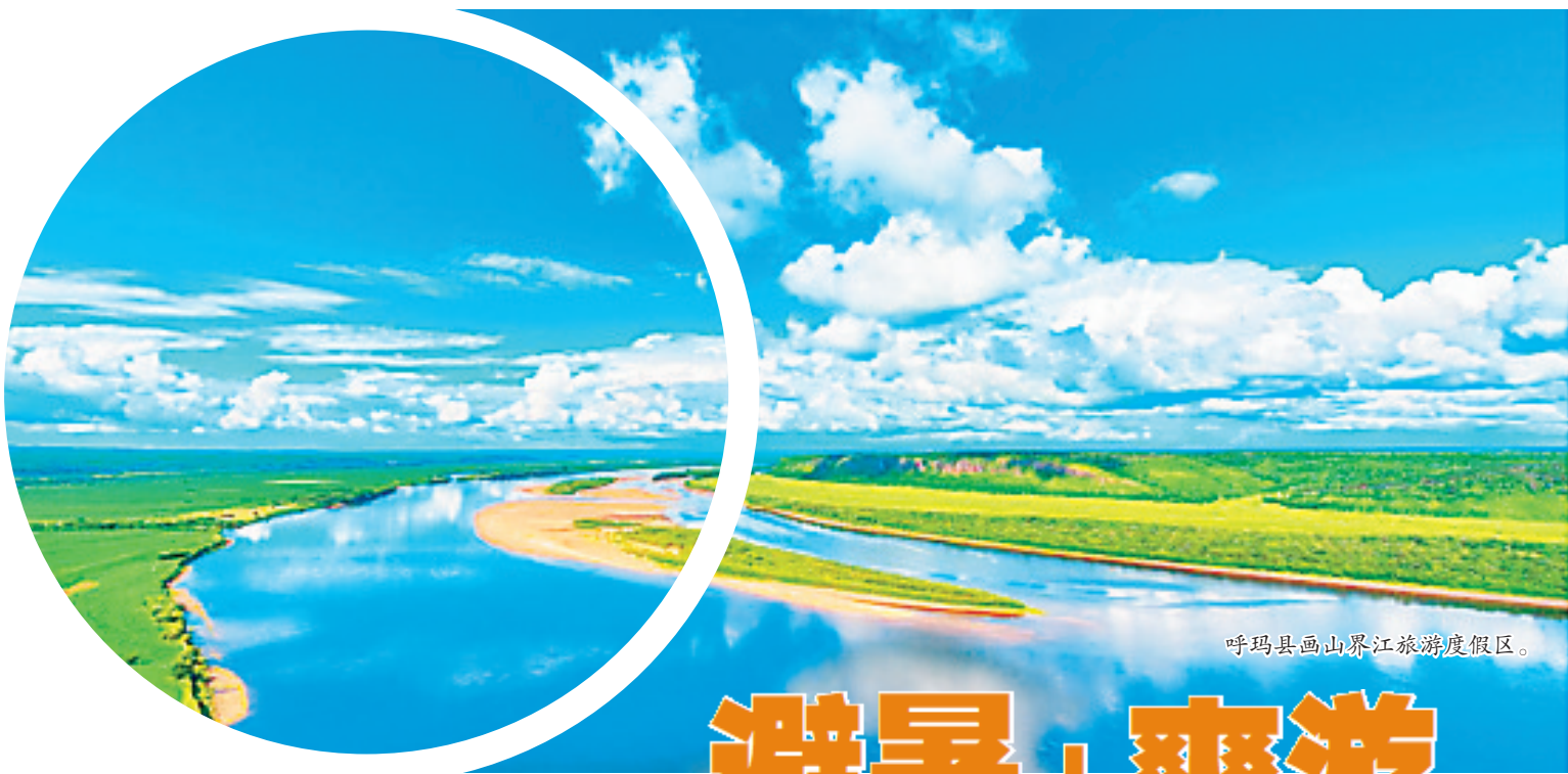
呼玛县画山界江旅游度假区。

据了解,为加快创意设计产业发展,道里区围绕曼哈顿商圈、爱建商圈、中央大街商圈,通过曼哈顿时尚生活创意产业园、似水文化创意产业园等园区的打造,让传统商圈焕发新活力,加速促进创意设计产业跨越式增长、规模化发展。