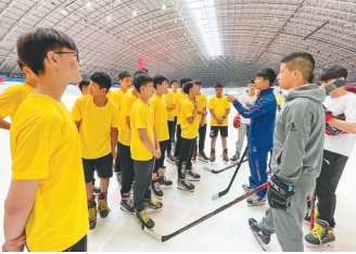
专业教练现场指导。

7月21日,齐齐哈尔市首届冰雪夏令营开营仪式在市冰上运动中心黑龙速滑馆举行。盛夏时节,鹤城青少年争相参与,在活动中,真正感受到了“亚洲最佳冰球城市”的魅力,不论是学生、家长、教练,还是社会各界人士,纷纷为这点赞。