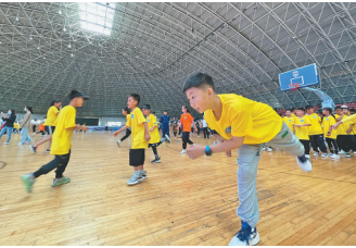
开展陆地训练。

据介绍,今夏齐齐哈尔精心策划推出了“齐齐哈尔市冰雪夏令营”“亚洲最佳冰球城市消夏之旅”等精品旅游线路和产品,鹤城广袤的湿地、美丽的丹顶鹤、飘香的烤肉、刺激的冰雪运动,必将给鹤城学子和广大游客留下难忘的体验。