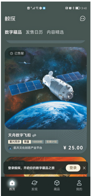
平台发行的天舟数字飞船藏品。

在我国数字经济浪潮中,数字藏品正悄然形成一股热潮。当前我省数字经济产业在多元政策赋能下,正乘风起航,数字藏品到底是什么?它在数字经济背景下意义何在?记者日前进行了采访。