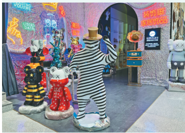
“市集”内设计创意十足。

传统零售业转型晋升创意感十足的网红打卡地。22日,作为哈尔滨市道里区打造创意设计产业内容之一,曼哈顿厦“慢生活市集”开市。“重体验”场景的构建,在满足年轻客群对时尚文化、品质生活消费需求的同时,为区域创意设计产业发展添翼。