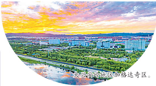
大兴安岭地区加格达奇区。