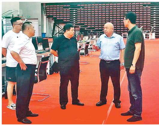
以学院主要负责人为组长的承办工作组到比赛场地进行检查

这是一场紧扣时代脉搏的职业技能“超级大赛”——规格之大、水平之高,来自全国高职院校电子信息领域技能高手将在这里诠释劳动之美、技能之光。