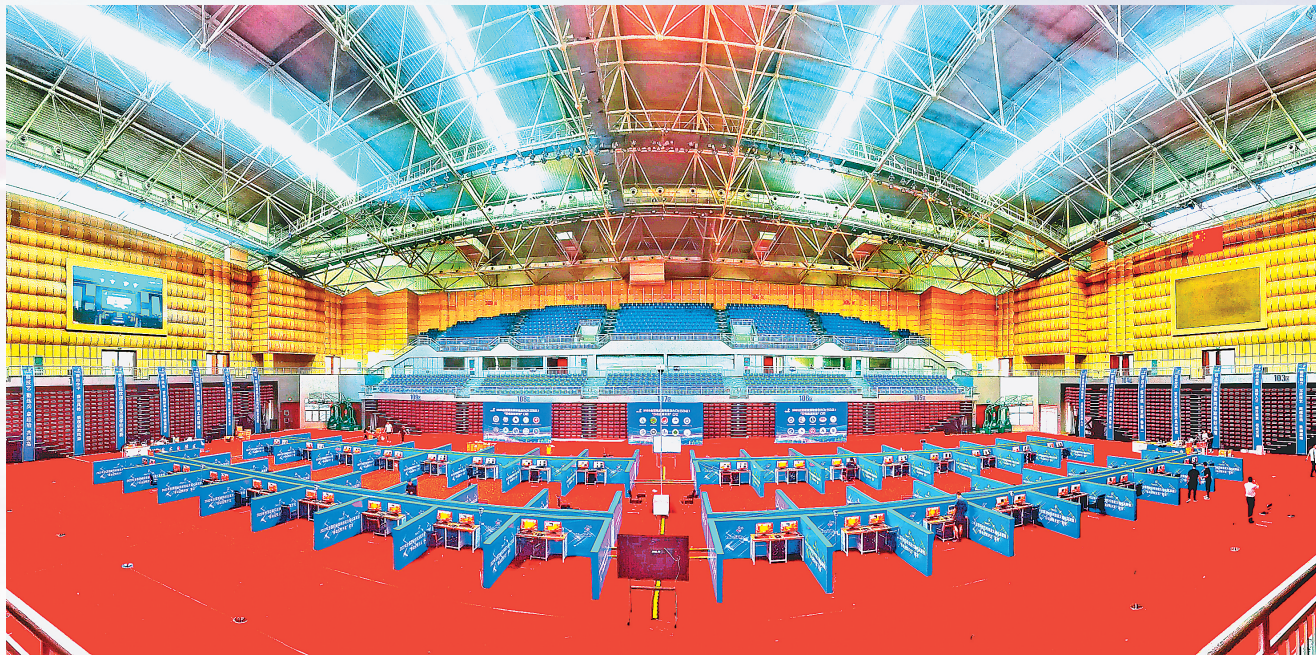
2022年全国职业院校技能大赛“移动应用开发”赛项比赛场地