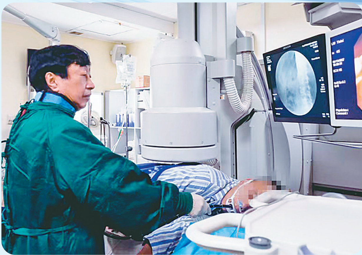
任旭进行内镜下操作。

深厚的专业造诣和严谨认真的作风奠定了任旭在我国消化内镜领域卓越的学术地位,他曾任两届中华消化内镜学会全国副主委,现担任中国医师协会理事、中国医师协会内镜分会副会长等学术任职,担任中华消化内镜杂志等多种杂志的副主编及编委,享受国务院特殊津贴。曾获全国卫生系统先进工作者荣誉称号。在2017年首届“国之名医”评选活动中,任旭成功入选国家名医榜,获得“国之名医·卓越建树”奖,是当年我省唯一获此项殊荣的专家。