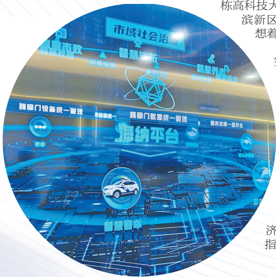
数字化管理展示