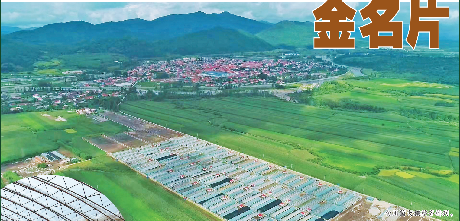
食用菌大棚整齐排列。