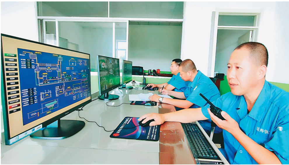
工作人员通过智能监测系统实时掌握生产情况。

供水基础设施升级改造过程中,延寿县把二次供水质量是否达标与安全作为重要指标,进行全链条建设与改造,管好“水龙头”,确保“最后一公里”水质安全。马延军说,二次供水设施改造项目启动后,延寿县把居民小区进行重新整合,每20个小区纳入一个系统,进行二次供水泵站的升级改造,并由供水企业统一管理。