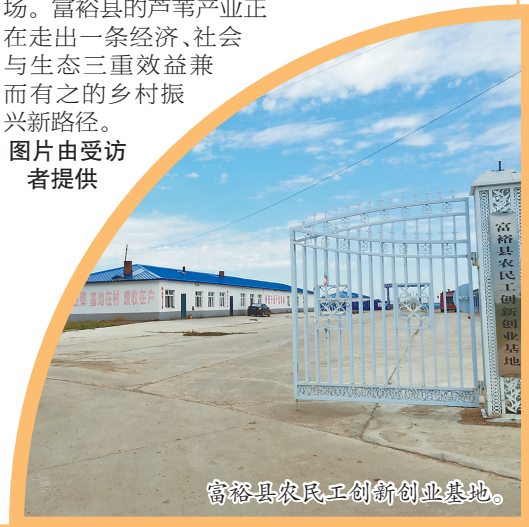
富裕县农民工创新创业基地。