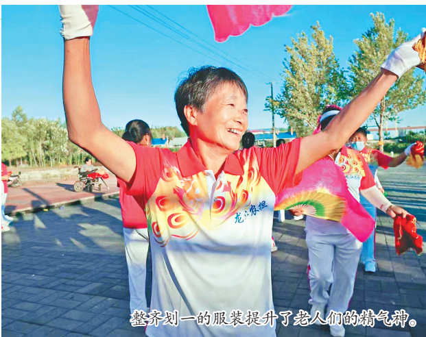
整齐划一的服装提升了老人们的精气神。