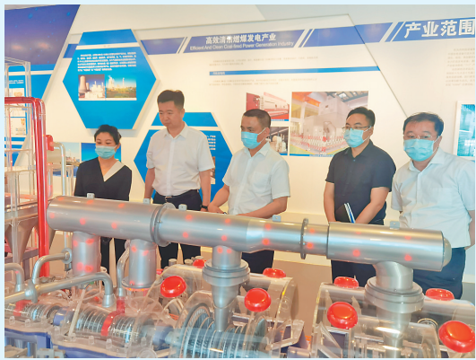
富拉尔基区委主要领导深入企业现场解决问题。

本报讯(路久宽 记者姚建平)近年来,齐齐哈尔市富拉尔基经济开发区在打造特色载体、推动大企业转型升级、中小企业创业创新发展上,用改革的思路、创新的模式,依托现有产业基础,重构特色载体创新体系和公共服务机制,探索出一条大中小企业融通发展的新路径。