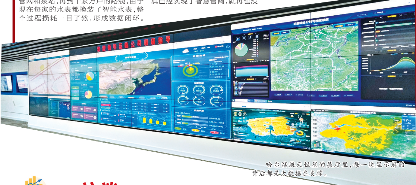
哈尔滨航天恒星的展厅里，每一块显示屏的背后都是大数据在支撑。

哈尔滨航天恒星在数据资源服务方面，形成了“天-空-地”立体化数据服务产品体系。截至目前，哈尔滨航天恒星的数据服务业务已拓展到省内哈尔滨、齐齐哈尔、牡丹江、大庆等主要地市，省外面向北京以及浙江、四川、新疆、云南、江西等22余个省市地区开展服务，从智慧城市、到智慧三农、再到生态大数据，抓住数字产业化的机遇，全力支撑黑龙江省卫星应用产业及数字经济发展，打造龙江战略性新兴产业名片。因为有了航天恒星的助力，黑龙江省不仅在空间数据处理方面在全国走在前列，还成为卫星资源利用、北斗导航与遥感产业化应用示范的主要省份之一。