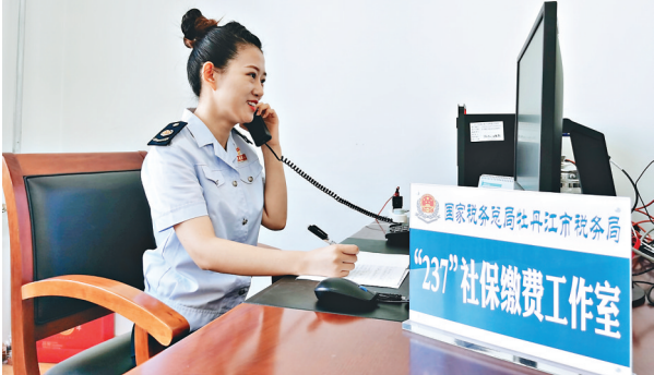
“237”工作室税务干部正在接听咨询电话。