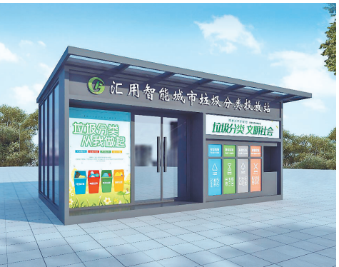
智能垃圾桶设计图。

“其实世界上没有废品，只有放错地方的资源。按照垃圾分类，塑料就可以粗略分为七大类110多个品，塑料的应用范围很广，我们穿的衣服也能用上塑料。”于海龙说，橡胶、易拉罐等其他可回收物会送往牡丹江市已有的处理中心进行破碎打片，物尽其用。