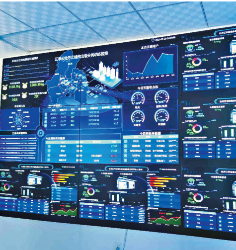
汇享云牡丹江城市垃圾分类动态监控平台。