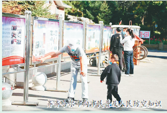
齐齐哈尔市向市民普及人民防空知识