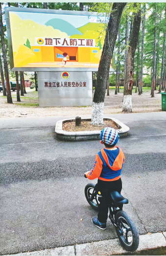
普及国防教育知识