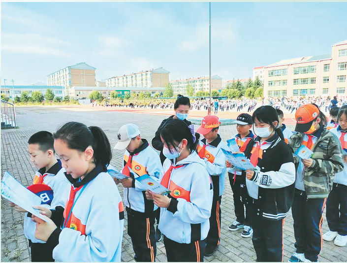
伊春市丰林县人防宣传进校园