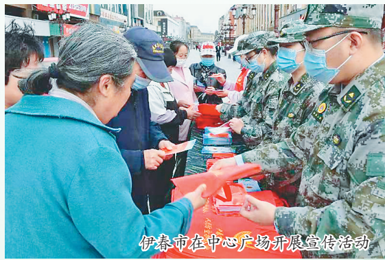
伊春市在中心广场开展宣传活动