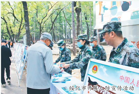
绥化市开展人防宣传活动