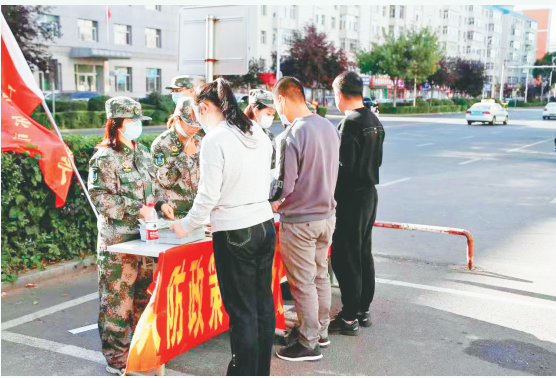
人防宣传增强市民国防观念和防空意识

铁力市举办了铭记历史、振兴中华“九一八”诵读活动,铁力市老年大学的学员们饱含真情诵读了自己创作的作品,回顾了中华英雄儿女浴血奋战、军民一心、共同抗击日本帝国主义的抗争史。学员们还来到铁力市图书馆参观党史文化墙,真切感受中国共产党的光辉历程。在党旗下,全体党员重温了入党誓词,庄严承诺为共产主义奋斗终身。