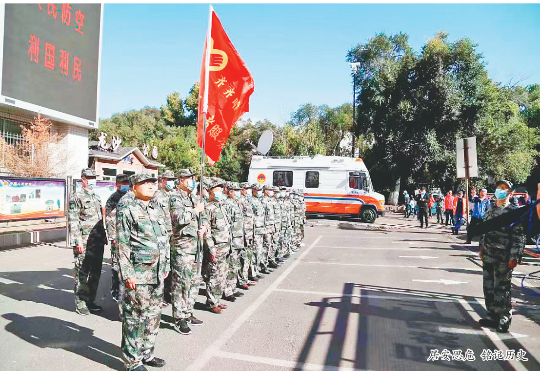
居安思危 铭记历史

伊春市人防办采用线上线下相结合的方式开展“九一八”宣传活动,形式新颖,内容丰富。通过在《伊春日报》刊登人防专刊,在伊春电视台进行专题报道,