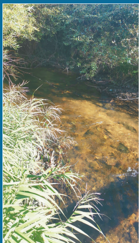
水库上游的撒沙河清澈见底。

近年来,磨盘山水库年度全国水源地环境状况评估结果一直保持优秀。这正是近期,国家环保督察组踏查后给与肯定,并列为环境保护的典型的原因所在。近日,记者来到距离哈尔滨200公里外的磨盘山水库,近距离感受水源地生态保护。