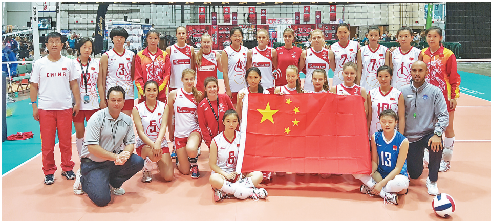
促进排球新发展,打造特色教育品牌。