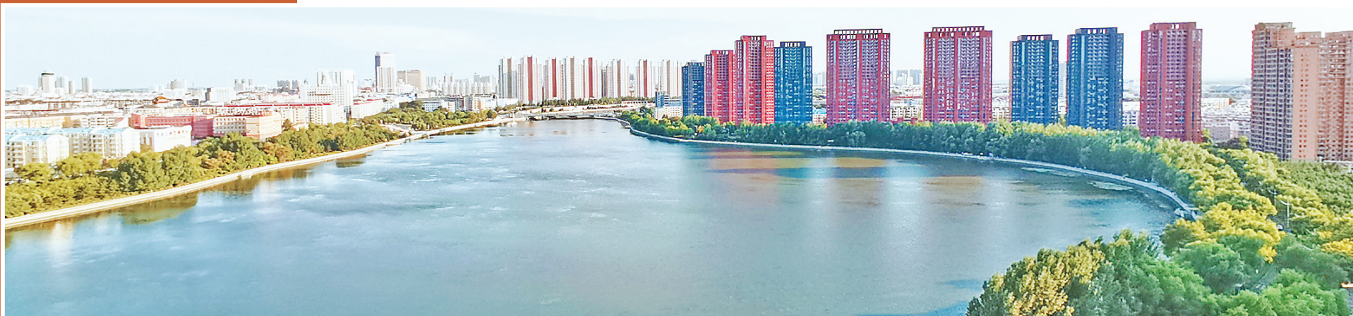
美丽的劳动湖景色。