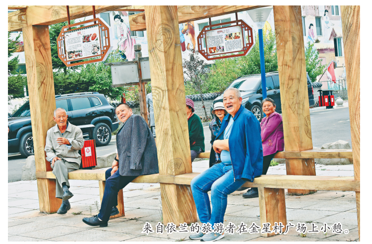
来自依兰县的旅游者在金星村广场上小憩。

除了旅游业,汤原县还建设了新建村、民主村、红胜村等村屯食用菌、兴顺村姑娘、北向阳村特色菜园,东大桥村果蔬基地,新兴村五味子、伏胜村小龙虾等特色种养产业,有效提升了村集体经济。他们还开展菜园革命,采取“种植有补贴、技术有指导、成本有支持”的方式,通过种植芦笋、鹅草、北药等经济作物,发展省级菜园革命示范村42个、种植规模2130亩,户均增收1200元。通过这些产业带动,2021年,汤原县农村居民人均可支配收入实现14210元,比2016年增长78.1%。