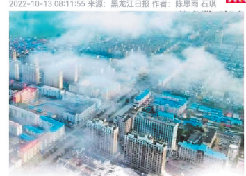
位于松嫩平原腹地的龙江县。