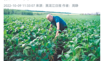
专家在查看大豆生长情况。