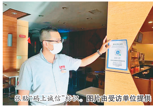
张贴“码上诚信”标识。

本报讯(王晨 记者张雪地)近日,记者从牡丹江市营商环境建设监督局获悉,“码上诚信”工作开展以来,截至目前,牡丹江市赋码市场主体148685户,占市场主体总数72%。