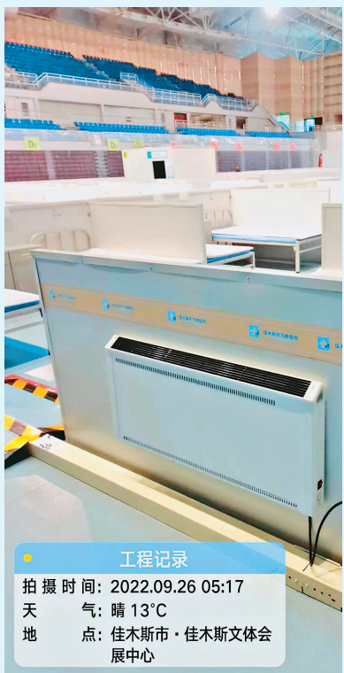
工程记录 拍摄时间:2022.09.26 05:17 天气:晴 13°C 地点:佳木斯市·佳木斯文体会展中心 石墨烯远红外智能电采暖方舱医院F区。