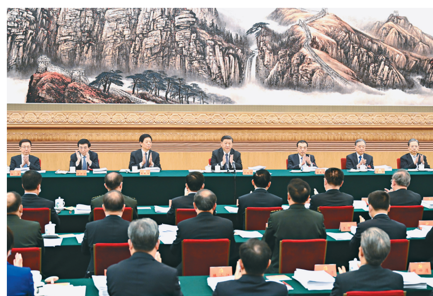
10月18日,中国共产党第二十次全国代表大会主席团在北京人民大会堂举行第二次会议。习近平、李克强、栗战书、汪洋、王沪宁、赵乐际、韩正等出席会议。

新华社北京10月18日电 中国共产党第二十次全国代表大会主席团18日下午在人民大会堂举行第二次会议。 习近平同志主持会议。 会议通过了将关于十九届中央委员会