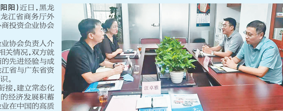
座谈会现场。

双方期望加强一南一北资源衔接,建立常态化沟通,充分利用协会平台,为两省的经济交流合作力量与资源,共同推动外商投资企业在我国的高质量发展,为黑龙江和广东的经济发展贡献力量。