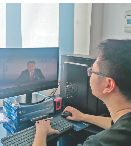
小微企业相关负责人在听政策解读。