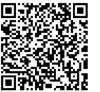
龙江农业好品牌之饶河东北蜂蜜