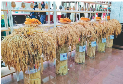
省农科院优秀水稻品种展示。

记者从全省农作物专家育种示范基地现场观摩会上了解到,省农业农村厅对全省6个市地的709个农作物品种进行示范评价。经专家田间现场综合评价,共113个优异农作物品种脱颖而出。其中,玉米21个、水稻27个、大豆29个,高粱、西甜瓜、马铃薯、蔬菜等非主要农作物36个。