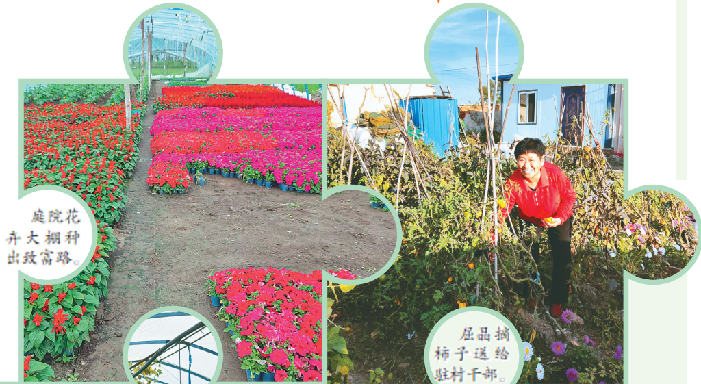
庭院花卉大棚种出致富路。

2022年初以来,抚远市坚持把“推动脱贫户(监测户)在较高收入基数基础上继续实现稳定增收”作为巩固拓展脱贫攻坚成果的重中之重,坚持“精准方略”“责任落实”“帮扶到位”,有效助推乡村振兴工作再上一层楼。