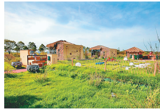
宝泉镇春光村朝鲜族风情建筑。

本报(苏广鑫 记者孙昊)克东县坚持建立健全农村环境长效管护体系,加快美丽宜居村庄建设步伐,走出了一条环境优美、村容整洁、田园怡静的美丽乡村建设之路。