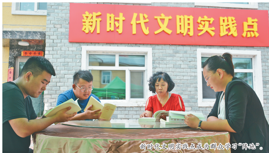
新时代文明实践点成为群众学习“阵地”。

为打造“志愿+”服务集群,该县建立由县委书记担任志愿服务总队长,各乡镇党委书记、县直各部门主要领导任支队长,村