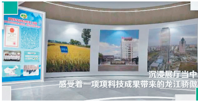
沉浸展厅当中 感受着一项项科技成果带来的龙江骄傲

质量安全是黑龙江最硬底线。 黑龙江已建成较为完善的农产品质量安全追溯体系,2500多家生产主体入驻农产品质量安全追溯平台,实现“从农田到餐桌”全程追溯;绿色、有机食品数量近3700个,农产品地理标志登记数量168个,已成为“安全食品”的代名词。