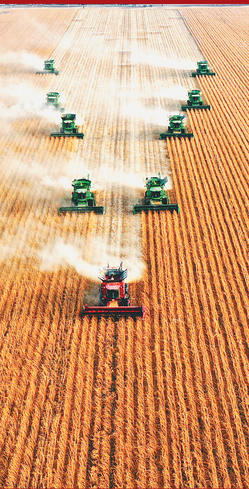
2022年克山农场24万亩大豆喜获丰收。

克山农场有限公司正步履铿锵地走向新时代,时刻牢记打造“大粮仓”的初心使命,心怀职工群众对美好生活向往的奋斗目标,用一张机制更活、农业更强、民生更优的蓝图实干到底,交出企业高质量发展的崭新答卷。