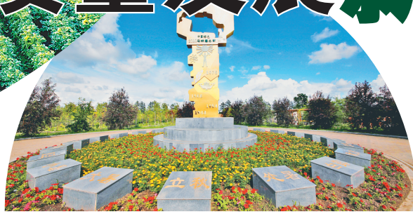
克山农场有限公司科技园区(资料片)。