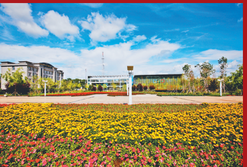
克山农场有限公司时代广场(资料片)。