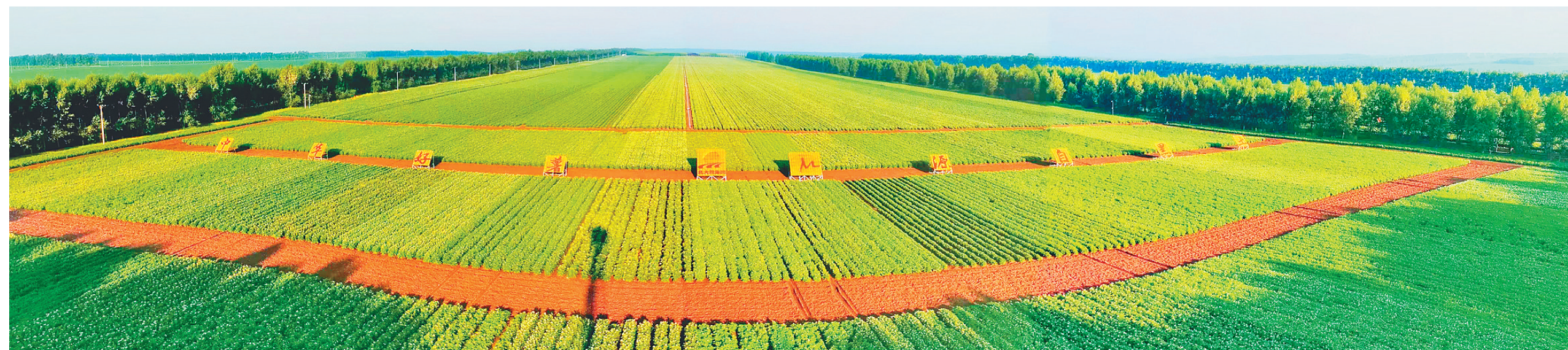
克山农场有限公司第二管理区马铃薯示范种植地块(资料片)。

新征程肩负新使命,新时代展现新作为。在垦区建设“三大一航母”的新征程中,克山农场有限公司将持续转变作风、解放思想,拿出攻坚克难的决心、爬坡过坎的信心和干事创业的恒心,积跬步至千里,汇小流成江河,奋力追赶新目标、创造新成绩。