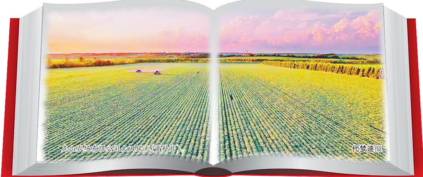
克山农场有限公司田间风光(资料片)。

秋收时,克山农场有限公司6.2万亩马铃薯紧锣密鼓开展了收获工作。与此同时,位于克山农场的薯业集团全粉公司也第一时间开秤收薯,全体党员干部奋斗在生产加工前线。今年,公司预计收购马铃薯原料5万吨,比去年增加了20%左右,计划生产成品9000吨,对提前交售马铃薯的种植户给予每斤0.6元的优厚价格,促进公司和农户双赢。同时,这家公司发挥党建共建示范引领作用,在收薯加工期间提供了80个临时就业岗位,既提升了收薯质量,也增加了部分职工收入。