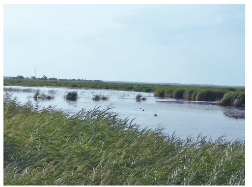
秋日湿地鸥鸟翔集。

经过夏秋的风，芦苇浓密茂盛，湿地已成为候鸟的天堂，平静的水面上，芦苇在悄悄地拔节，归来的各种水鸟在静静地觅食，偶尔有鸟儿划过水面，溅起层层涟漪，一会儿工夫又恢复平静。你也会看到很多小鱼儿自在地游来游去，它们和谐共处，共同度过湿地里的宁静时光。