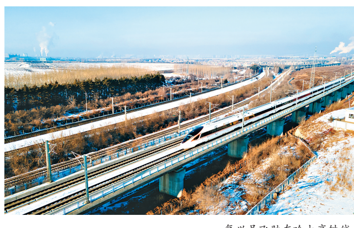
复兴号飞驰在哈大高铁线上。

本报讯(记者狄婕)记者从中国铁路哈尔滨局集团有限公司获悉,12月1日,世界首条高寒高速铁路哈尔滨至大连高速铁路迎来开行十周年纪念,哈大高铁是我国高寒地区客流量最大、最繁忙、运行里程最长的高速铁路,十年来累计安全运送旅客6.7亿人次。