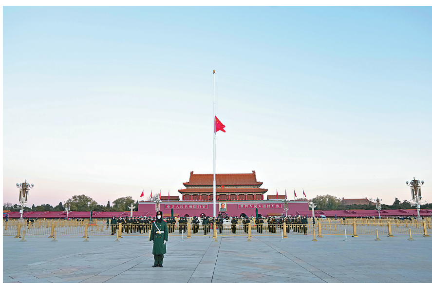
12月1日,北京天安门下半旗志哀,悼念江泽民同志逝世。

中央和国家机关、各人民团体第一时间通过电视、广播、网络等形式收听收看告全党全军全国各族人民书。大家表示,二十世纪八十年代末九十年代初是决定党和国家前途命运的重大历史关头,江泽民同志带领党的中央领导集体,紧紧依靠全党全军全国各族人民,旗帜鲜明坚持四项基