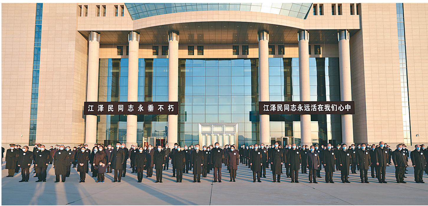
12月1日,江泽民同志的遗体从上海由专机敬移到达北京。习近平、李克强、栗战书、汪洋、李强、赵乐际、王沪宁、韩正、丁薛祥、李希、王岐山等党和国家领导同志到北京西郊机场迎灵。蔡奇等从上海护送江泽民同志遗体回到北京。

新华社北京12月1日电 我党我军我国各族人民公认的享有崇高威望的卓越领导人,伟大的马克思主义者,伟大的无产阶级革命家、政治家、军事家、外交家,久经考验的共产主义战士,中国特色社会主义伟大事业的杰出领导者,党的第三代中央领导集体的核心,“三个代