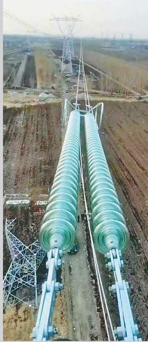
机场第二通道高压线路迁改现场。

安全,哈市规划构建磨盘山和松花江双水源供水格局,哈城投集团承担着松花江水源上移及输水管线项目建设任务,项目建成后每天供水量可达110万吨,可为双城区、临空经济区每天各提供5万吨净水,为松北区每天提供17万吨原水,改善主城区200余万户居民供水格局。 据了解,今年以来,哈城投集团同步推进大项目建设和企业转型发展,全力推进机场第二通道、松花江水源上移、中华巴洛克三期等重点项目和重大民生工程建设。克