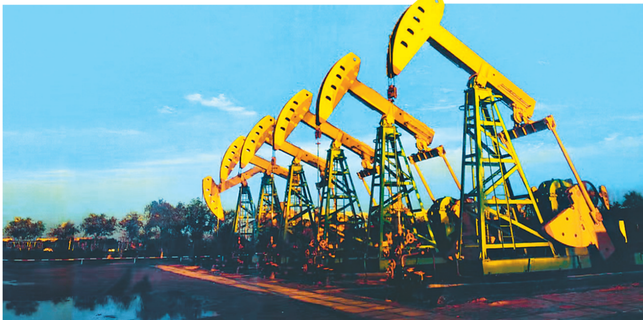
中国石油大庆油田有限责任公司采油生产平台。

当人们还沉浸在中华大粮仓、粮食安全压舱石黑龙江农业发展的壮美画卷中时,伴随讲解员的引导,“奋进新时代”主题成就展黑龙江展区第二组关于保障国家能源安全产业安全的内容映入眼帘:神华宝清煤矿首个千万吨级露天开采矿,大庆油田古龙页岩油勘探取得重大突破性突破,翱翔在天空中的“神舟”号系列飞船、“天宫”空间实验室,入海“奋斗者”号潜水器、国产航母、燃气轮机、超越国际汽轮机发电、超超临界燃煤锅炉、空冷风机、重型高档数控机床等创新产品已达到或接近世界先进水平的国之重器……这是十年来,我省落实统筹发展和安全重大责任,推进产业体系自主可控的丰硕成果展示。