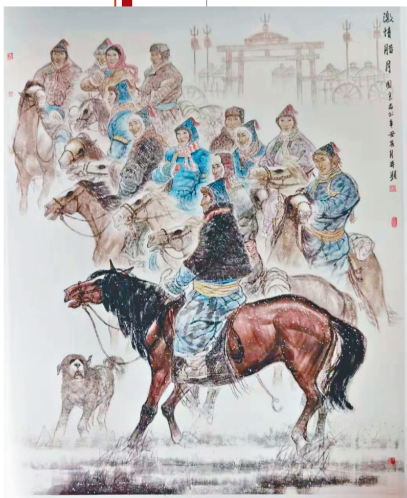
吴团良 《激情腊月》 200cm x 240cm