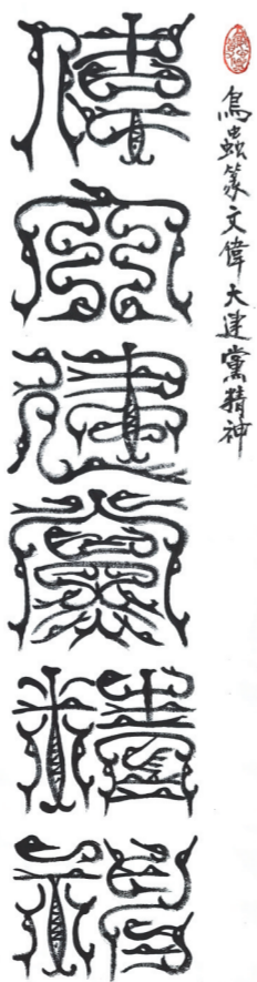
高升民 《传承建党精神》 135cm x 68cm