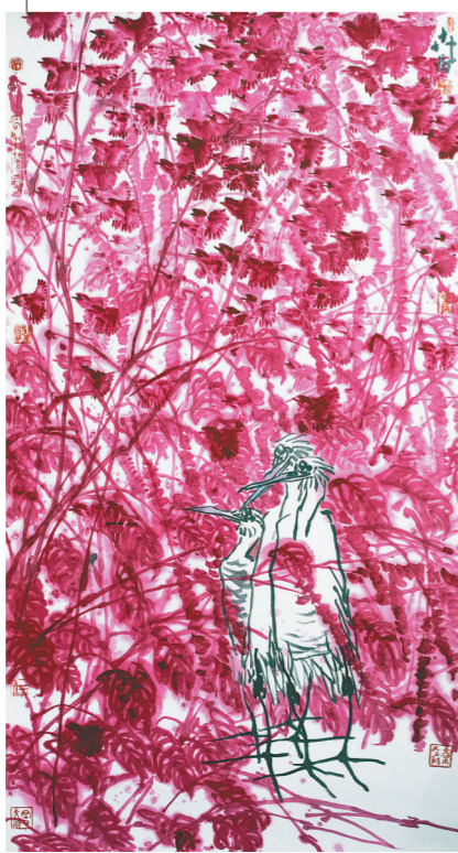
高升民 《红菱燕舞》 97cm x 178cm 中国画