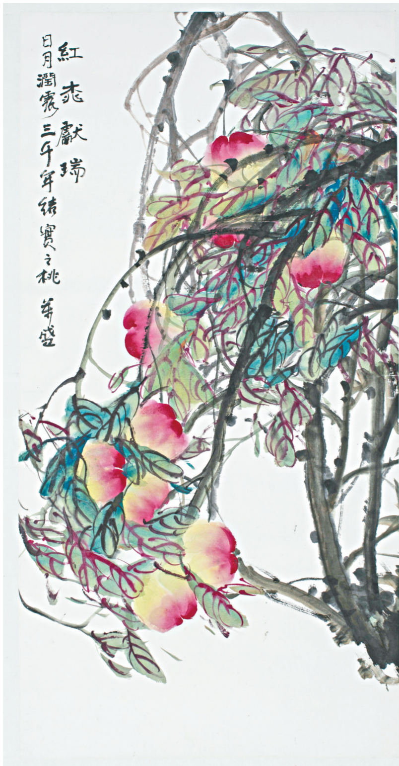
红桃献瑞 日月润露三千年结实之桃并盛