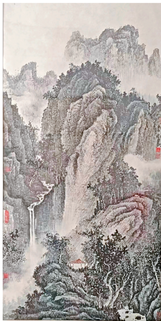
赵庆忠 《大别山春色》 135cm x 68cm