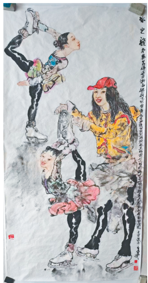
张金武 《冰之韵》 133cm x 68cm