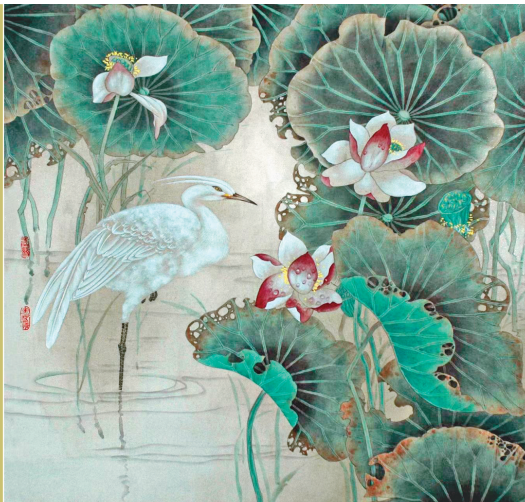
徐晓丽 《和谐》 68cm x 68cm