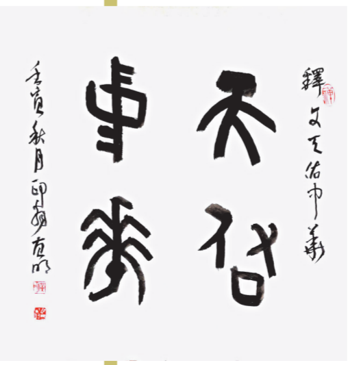
黄明 《天佑中华》 69cm x 69cm