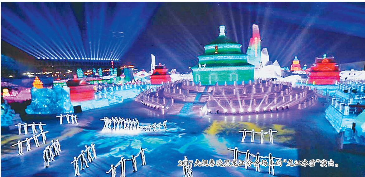
2017央视春晚黑龙江分会场上的“龙江冰雪”演出。