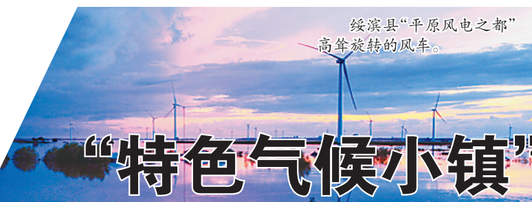
“特色气候小镇”评选结果公示!

据省文旅厅副厅长侯伟介绍,下一步我省将提高政治站位,以习近平新时代中国特色社会主义思想为指导,充分尊重人民群众的主体地位,贯穿新发展理念,在建设推动优秀传统文化创造性转化、创新性发展,切实开展好文化生态保护区创建工作;落实主体责任,按照要求完善制度建设,尽快研究制定省级及以下文化生态保护区建设管理规范,深度挖掘各地资源,把更多符合条件的地区评选出来,加快推进本地区文化生态保护区建设,进一步推动非遗区域性整体性保护工作落实;突出融合发展,从实际出发,不断探索非遗与旅游的有效对接、深度合作模式,充分发挥非遗在文化旅游发展中的作用,挖掘文化遗产的深层内涵和价值,让人民群众在文化生态保护区里深切感受地域文化和民族文化的独特魅力。