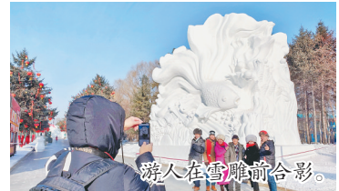
游人在雪雕前合影。

本报讯(记者蒋国红)“这个鱼雕得太好看了,快给我拍张照!”在第35届中国·哈尔滨太阳岛国际雪雕艺术博览会现场,游人或乘坐电瓶车,或徒步欣赏着美丽的雪雕盛宴。