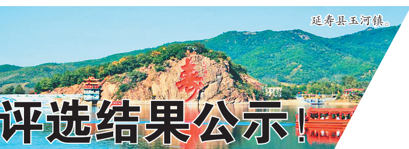
“特色气候小镇”评选结果公示!