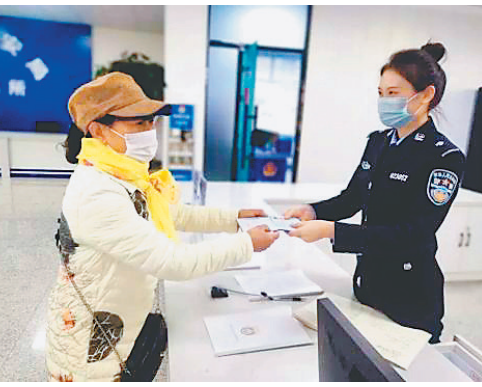
□文/摄影 张晓彤 本报记者 蔡轶 李爱民

对各区县(市)政府、市级各公共管理和服务机构未按照规定开放和更新本机构开放目录和公共数据,或者故意开放不真实、不准确、不全面开放目录和公共数据的;未按照规定对开放的公共数据进行脱敏、脱密等预处理的;未按照规定履行公共数据开放职责的其他行为的,依法依规追究直接负责的主管人员以及直接责任人员责任。