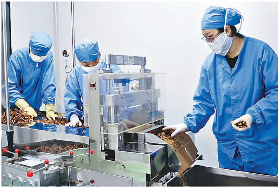
药企生产紧张而有序。

近段时间以来,哈药六厂从三条生产线、五条生产线直到六条生产线“马力全开”。目前,哈药六厂24小时不休,紧张而有序生产。