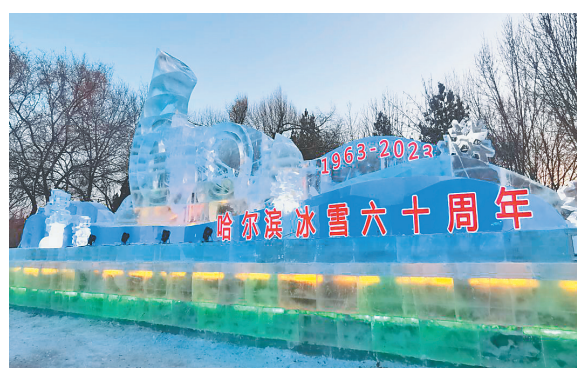
松北大冰峰路口冰雪景观《号角》。