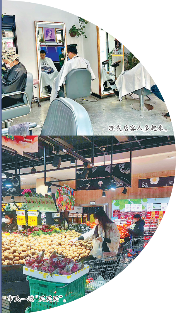
理发店客人多起来。