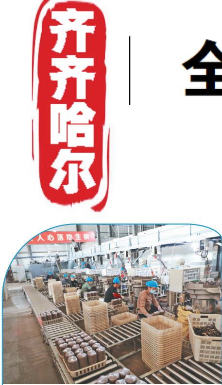
鑫鑫菌业菌包生产车间。