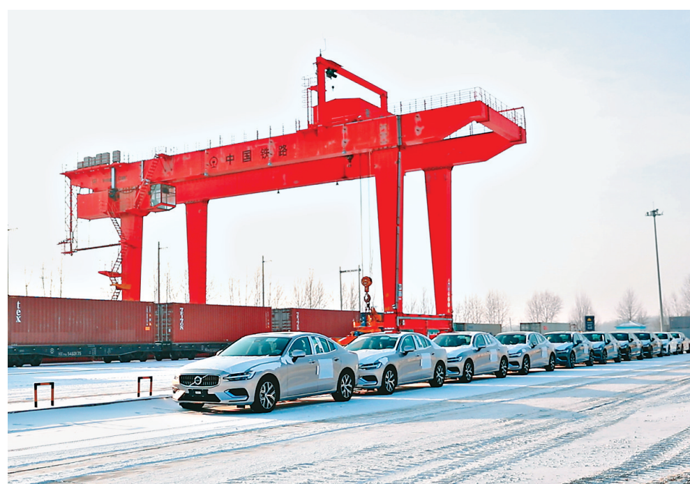
准备运输。

本报30日讯(记者狄婕)记者从中国铁路哈尔滨局集团有限公司获悉,30日11时50分,装载240台商品汽车的88316次货运列车,经大庆让胡路站始发,开往天津,这是春节假期后我省开行的首趟商品汽车定制货运专列。自2017年大庆地区开行商品汽车货运列车以来,铁路已为当地运送龙江制造商品汽车超过5.5万台。 春节假期后,各地积极帮助企业复工复产,哈尔滨局集团公司为企业定制“一厂一策”复工复产运输方案,对运输过程中的堵点、难点逐一疏通。定制专用运输车厢,运载量较以往提高一