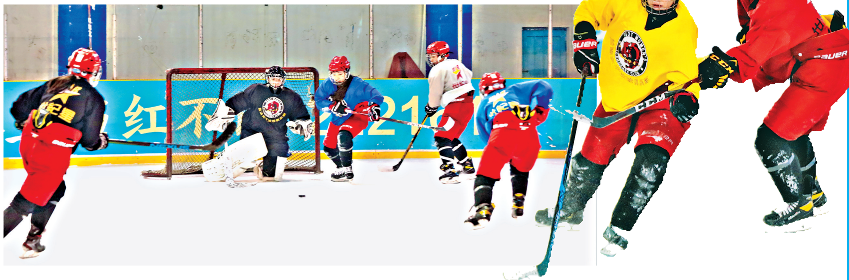
1月30日上午,春节长假刚过,齐齐哈尔市冬季运动项目中心华星体育馆冰球场上,齐齐哈尔市女子冰球队运动员以昂扬饱满的精神状态,开启春节后首训,备战即将到来的全国最高级别女子冰球赛事——“运建理工杯”全国女子冰球锦标赛。