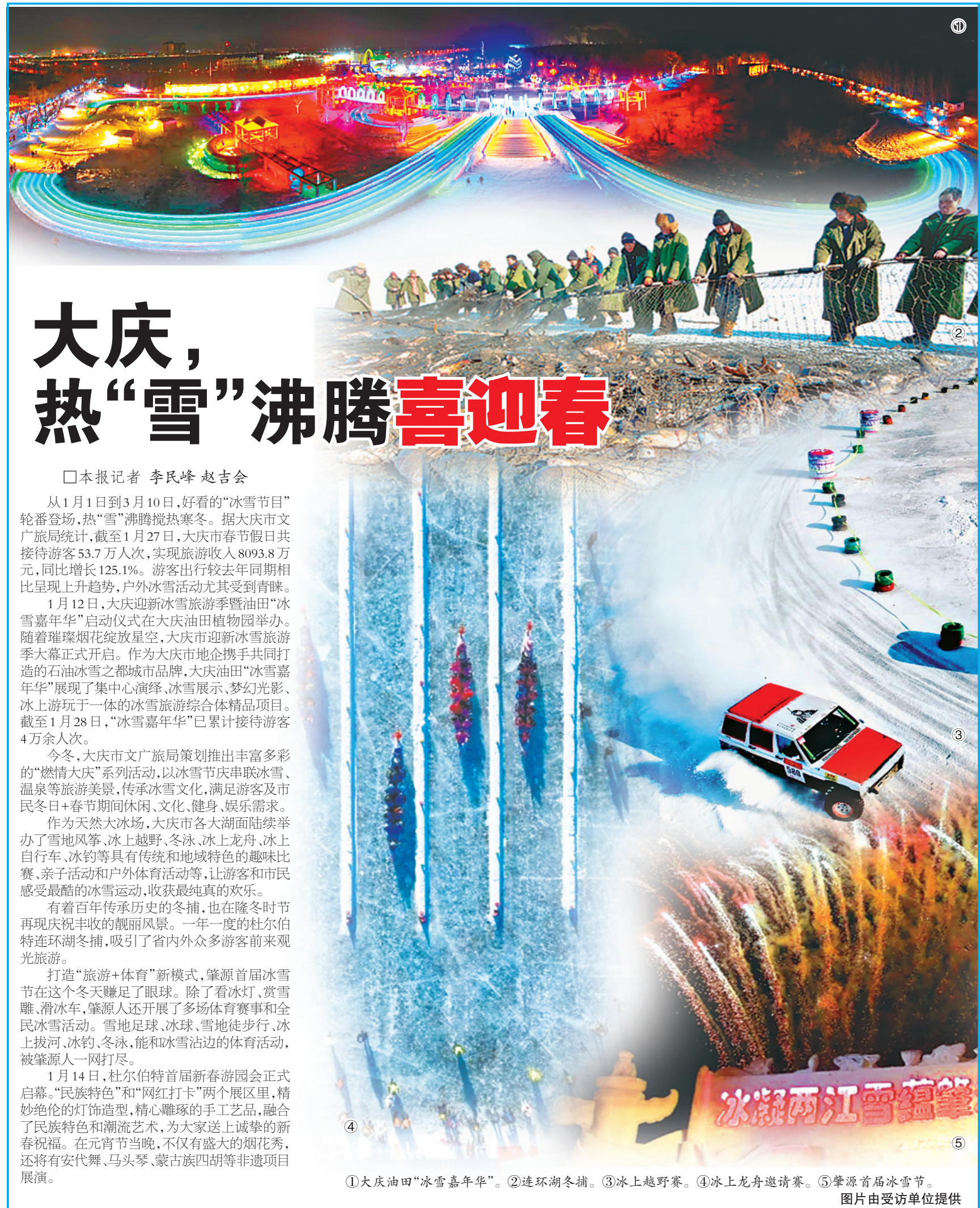
①大庆油田“冰雪嘉年华”。②连环湖冬捕。③冰上越野赛。④冰上龙舟邀请赛。⑤肇源首届冰雪节。