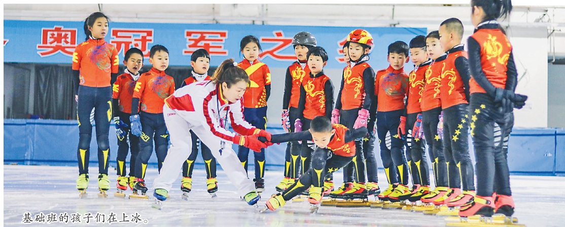
基础班的孩子们在上冰。

在七台河,孩子们从幼儿班特色启蒙开始,从低到高,走出一条体教融合梯次培养之路,形成特色校、基础班、重点班、省队、国家队“金字塔”式高水平体育人才培养输送梯队体系,是全国短道速滑人才储备最充足的城市。