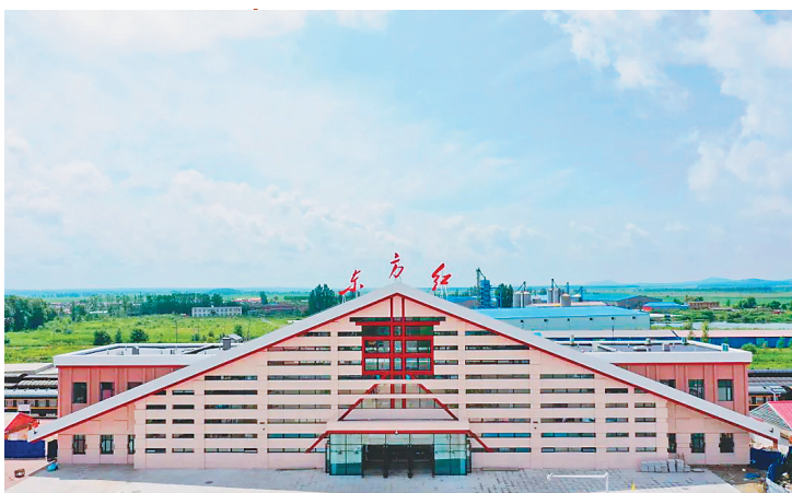
新建东方红站外观。

东方红的站名是王震将军给起的。最初的站房还是一个板夹泥的小平房。后来,改建为一个端庄方正、通体深红的站房。而如今,已是英姿焕发,充满新时代的活力。建筑面积不仅扩大了,而且进出站设置采用“平进平出”模式,更适应铁路“公交化”的高效运转,实现与城市交通的无缝衔接,旅客换乘更加便捷,让地处祖国边陲的人们感受到现代化的气息。在站台上有一个细节,需要来访者注意观察。“东方红站”的站牌和其它中间站的站牌不一样。一般站牌有前后两个到站的站名,一边是前方站,一边是后方站,但是东方红站因为是密东铁路的尽头站,所以只有前方站,也就是这上面标注的“迎春站”。新站房的落成,标志着这座饱含历史韵味的火车站从“旧时光”驶向了“新时代”。